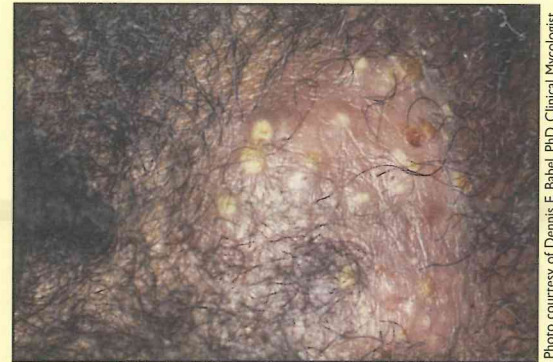
Inflammatory tinea capitis pustules on the scalp in an area of hair loss