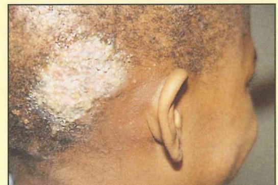
Tinea Capitis con formación de queriones y adenopatía cervical en un niño de 11 años