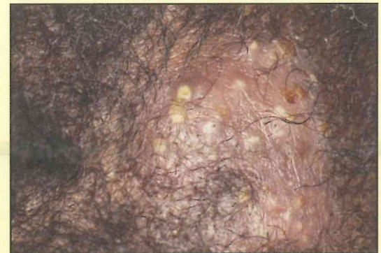
Tinea Capitis inflamatoria con pústulas en el cuero cabelludo en un lugar de pérdida del cabello