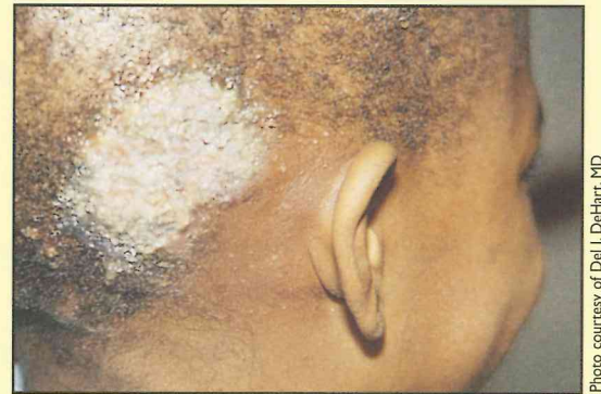
Tinea capitis with kerion formation and cervical adenopathy in an 11-year old boy