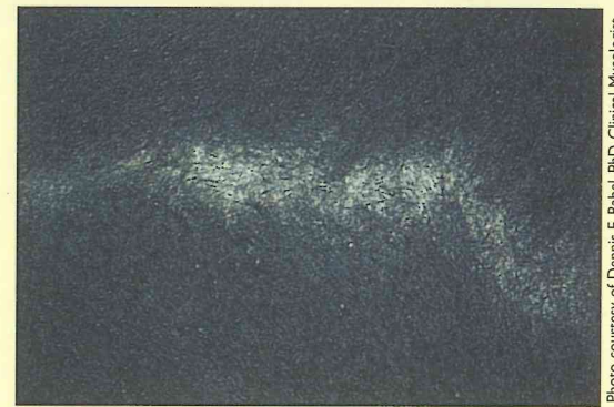
Mild tinea capitis (ringworm of the scalp) showing minimum hair loss and extensive scaling